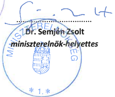
Dr. Semjén Zsolt miniszterelnök-helyettes